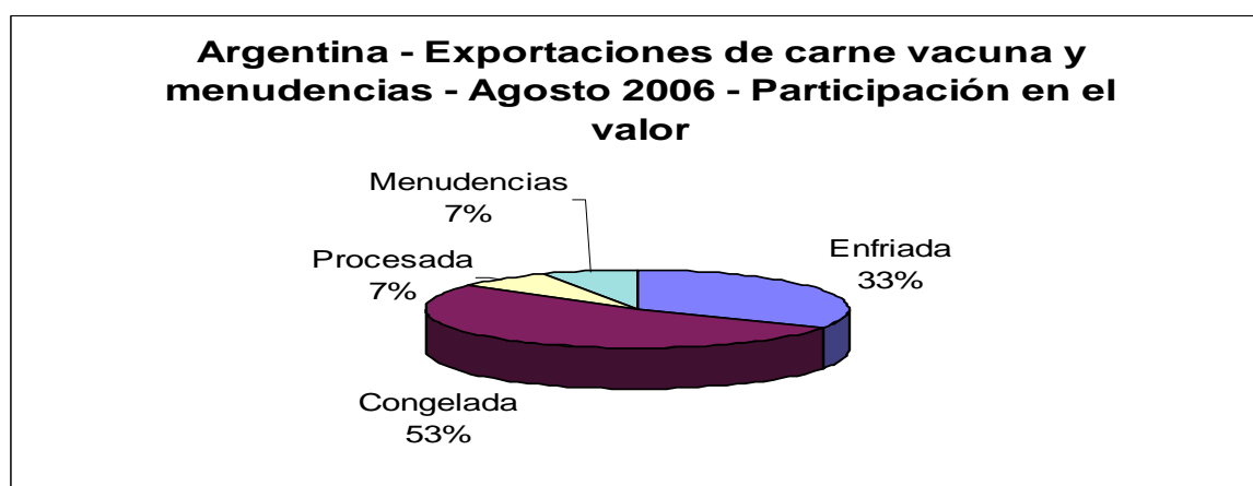
Gráfico n°3: Principales productos exportados en valor, agosto 2006:

Comparadas con las ventas externas de agosto de 2005, los embarques correspondientes a las posiciones arancelarias de carne enfriada sin hueso fueron 47% inferiores a las del año anterior. Sin embargo, en el caso de la carne congelada, se registró una suba de más del 28% si se compara con las correspondientes al mismo mes del año pasado. Las ventas de carne procesada fueron 31% inferiores a las de agosto de 2005.